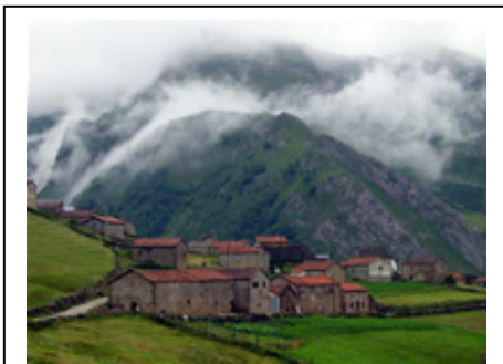
Detalle: La Peral.

La Peral , Pueblo situado a 1.360 m de altura, antes solo habitado en primavera y